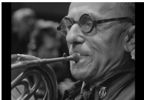
Muzykanci / The Musicians, R: K. Karabasz, PL 1960