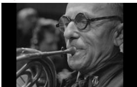
© Muzykanci / The Musicians, Reg. K. Karabasz, PL 1960, © WFDiF 2017

Am 22. Juni zeigen wir im Rahmen der Polnischen Filmreihe in Halle drei kurze Dokumentarfilme, die ihren Fokus auf eine symbolische und wortwörtliche Hochzeit, aber auch auf den Tod legen. Im Film Muzykanci / The Musicians von 1960 zeigt der Regisseur Kazimierz Karabasz in einer Fabrik arbeitende