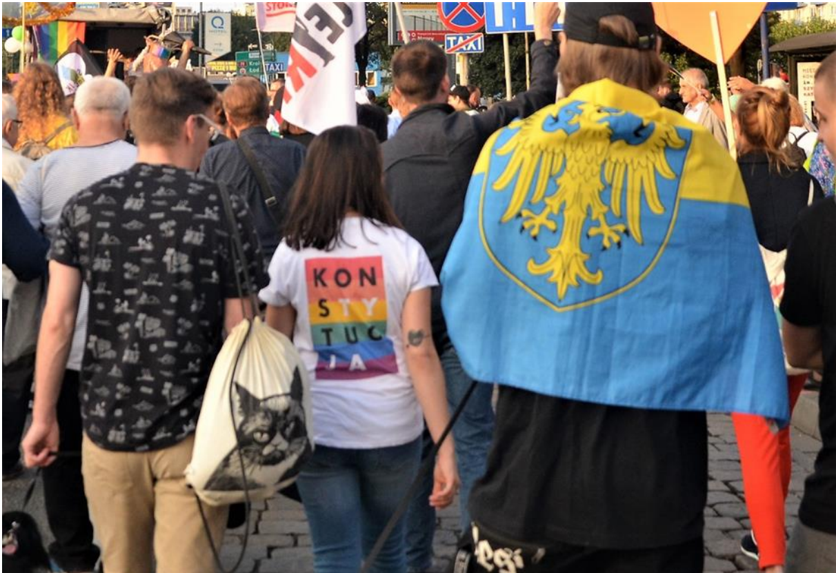
Demonstration für die Verfassung, 8. September 2018.

Verfassungsgeschichte steht kaum unter dem Verdacht, die Herzen vieler Historiker*innen, geschweige denn die einer breiteren Öffentlichkeit, höher schlagen zu lassen. Andererseits besteht ein großes öffentliches Interesse an den Verfassungen, insbesondere an der Verfassungsgerichtsbarkeit und der Unabhängigkeit der Justiz im östlichen Europa, wie die seit einigen Jahren virulenten Debatten um die Rechtsstaatlichkeit Polens und Ungarns zeigen. Es gibt also gute Gründe, tiefere Zeitschichten freizulegen, um die Argumente der Gegenwart abzuwägen. Wie aber könnte eine inhaltlich und methodisch erneuerte Verfassungsgeschichte aussehen?